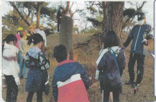
子供の頃に遊んだ勢見ヶ森! 山百合を皆に見て欲しい。また、遊べる場としても利用してほしいです。