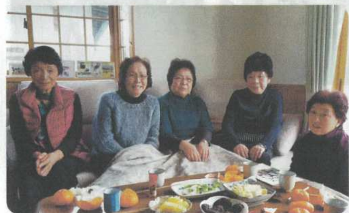
ビニールパレーを通して交流している約30年来の仲よしメンバー。毎日の散歩・お茶飲み会・ランチ会を楽しんでいます!