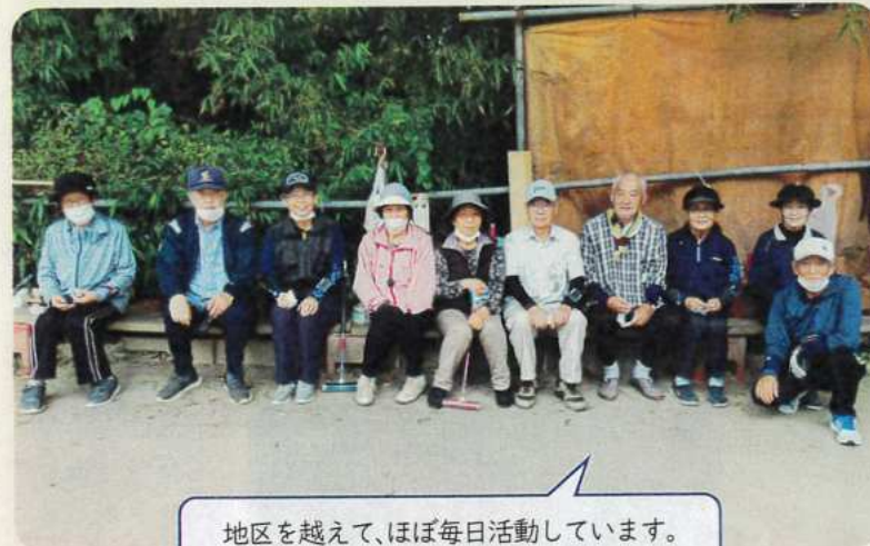
地区を越えて、ほぼ毎日活動しています。