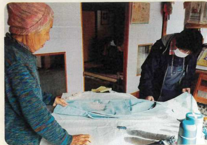
和裁の得意な方に着物のリメイクを相談中

東日本大震災の後、大郷に引っ越してきました。人形作りが趣味で、喜んでもらうのがうれしくて作っては時々知人にあげています。(女性)