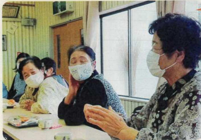
野菜作りのポイントを、メンバーの中で色々知ってる方に教えてもらいながら、会話が弾みます

毎月第2月曜日の午前中開催 農繁期5月・8月・9月休み 会費はお茶代として200円(必要時はその都度実費) 内容はその都度みんなで決めて活動中!