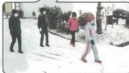
お互いの家が見え、ひとり暮らしなので、カーテンが開いているか、電気がついていないかを気にかけあっている。