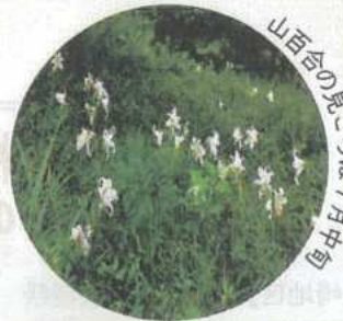
山百合の見ごろは7月中旬