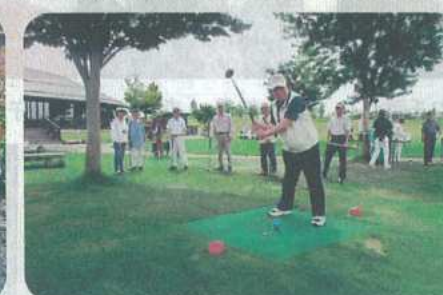
【土手崎地区】収穫祭パタンク