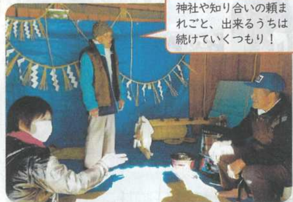
神社や知り合いの頼まれごと、出来るうちは続けていくつもり!